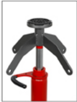
A-5181 Protección de goma. Opcional.