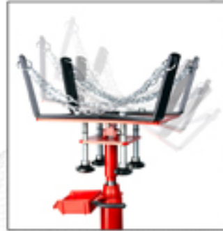
PF-1200A Plataforma ajustable con cadenas. Opcional.