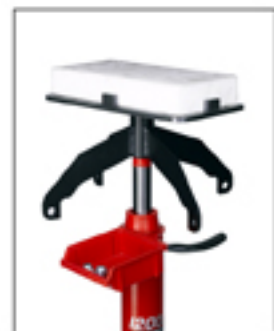
A-5183 Bloque de espuma protectora. Opcional.