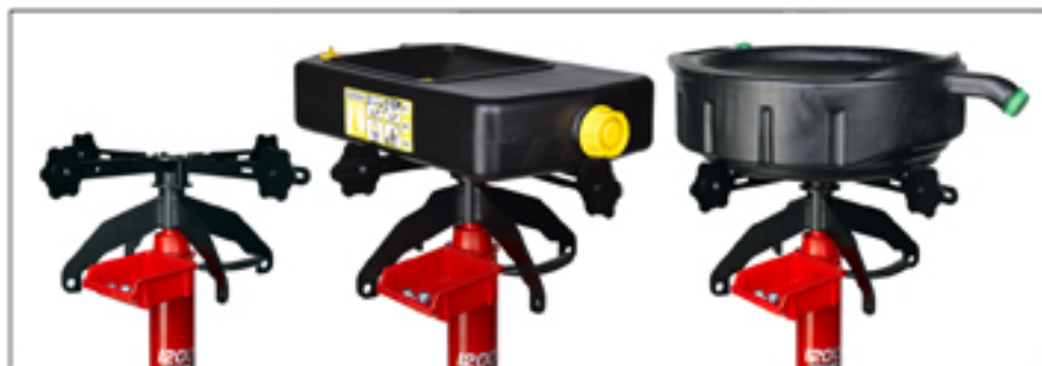
A-5184 Soporte ajustable, para bidones recogedores de aceite, de distintos formatos o diámetros. Diámetro máx. 485 mm. Opcional.