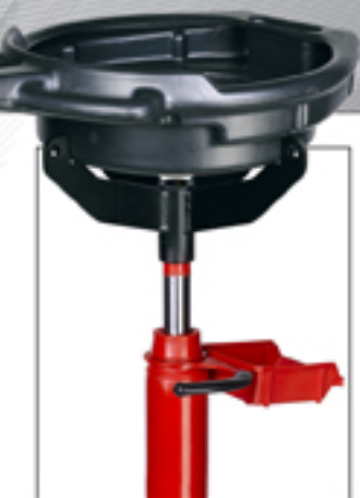
Soportes de nuevo diseño para alojar los recogedores de aceite.