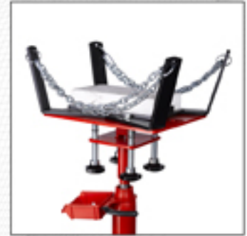
PF-1200A Bloque de espuma protectora. (A-5183). Opcional.