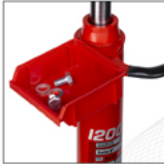
A-5187 El asa giratorio puede montar una caja portatorillos. Caja opcional.