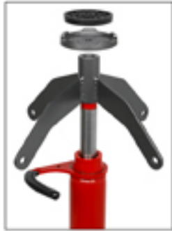
C-17 Platillo extra. Opcional.